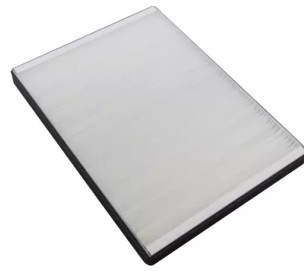
Hauptfilter 283x206x25mm für FilterCase Basic Artikel-Nr.: 978400012