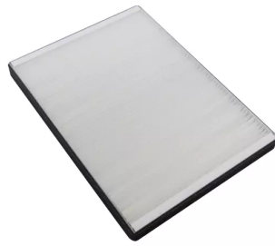
Hauptfilter 283x206x25mm für FilterCase Basic Artikel-Nr.: 978400012