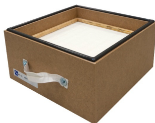
Partikelfilter H14, 610x610x292+6 Minip.100 Pa Artikel-Nr.: 50202146629