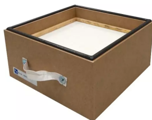
Partikelfilter H14, 610x610x292+6 Minip.100 Pa Artikel-Nr.: 50202146629