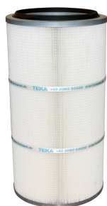
Filterpatrone, Typ easy clean plus Artikel-Nr.: 6160600212508