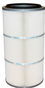
Filterpatrone, Typ easy clean plus Artikel-Nr.: 6160600207706