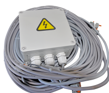
Master-Slave-Steuerung Artikel-Nr.: 15001001602