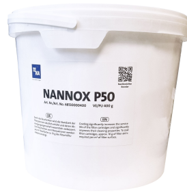
Filterhilfsmittel NANNOX P50 Artikel-Nr.: 68130000400