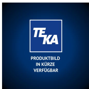
Frequenzumrichter mit Drucktransmitter Artikel-Nr.: 962002009030