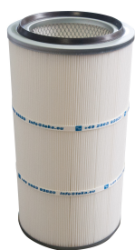
Filterpatrone, Typ Standard Artikel-Nr.: 6160600107808