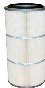
Filterpatrone, Typ easy clean nano Artikel-Nr.: 6160600312606