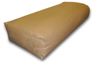
Filterhilfsmittel NANNOX P50 Artikel-Nr.: 68130010000