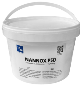
Filterhilfsmittel NANNOX P50 Artikel-Nr.: 68130000100