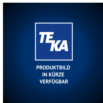
Übergangsstück für FilterCube 4 (SDK) auf NW 500mm Artikel-Nr.: 9501441940111