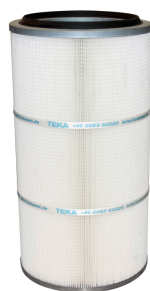
Filterpatrone, Typ easy clean nano Artikel-Nr.: 6160600307706