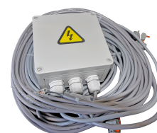
Master-Slave-Verbindungseinheit 24 V DC / 230 V AC Artikel-Nr.: 15001001604