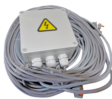
Master-Slave-Steuerung Artikel-Nr.: 150010016