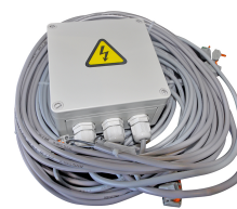
Master-Slave-Steuerung Artikel-Nr.: 150010032