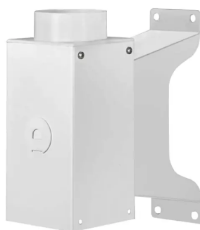
ALSIDENT Wandhalterung, DN75-50, weiß Artikel-Nr.: 2195