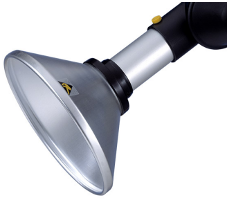
ALSIDENT Absaughaube rund, NW 50(AS), antistatisch Artikel-Nr.: 150246