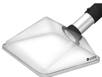
ALSIDENT Absaughaube eckig, NW 50, 245 x 220 mm, Artikel-Nr.: 1502422050001