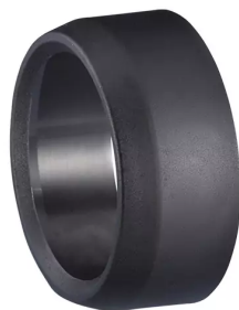
ALSIDENT Reduziermuffe 63 mm - 50 mm, schwarz Artikel-Nr.: 463506