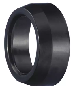
ALSIDENT Reduziermuffe 80 mm - 50 mm, schwarz Artikel-Nr.: 480506