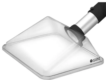
ALSIDENT Absaughaube eckig, NW 50, 245 x 220 mm, Artikel-Nr.: 1502422050001