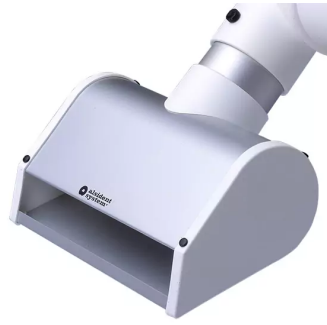
ALSIDENT Schlitzdüse NW 50, Breite 100 mm, weiß Artikel-Nr.: 150105