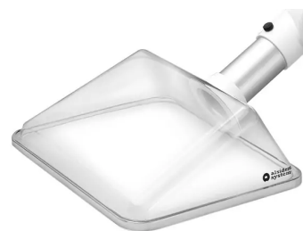
ALSIDENT Absaughaube eckig, NW 50, 300x250mm, weiß Artikel-Nr.: 15024225