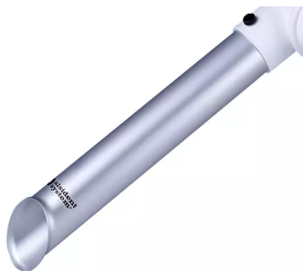
ALSIDENT Rohrdüse NW 50, lange Ausführung Artikel-Nr.: 15031