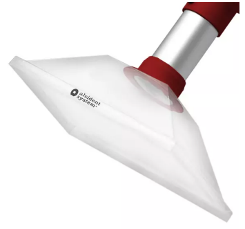
ALSIDENT Absaughaube eckig, NW 50, 265x170 mm, rot Artikel-Nr.: 15020154