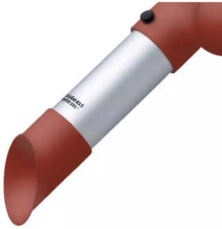
ALSIDENT Rohrdüse NW 50, mit rotem Plastikkopf Artikel-Nr.: 150224