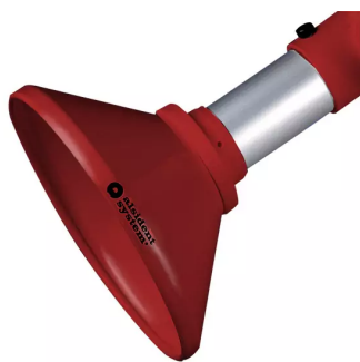
ALSIDENT Absaughaube rund, NW 50, d = 200 mm, rot Artikel-Nr.: 150244