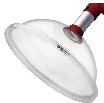
ALSIDENT Absaughaube rund, NW 50, d = 385 mm, rot Artikel-Nr.: 150354