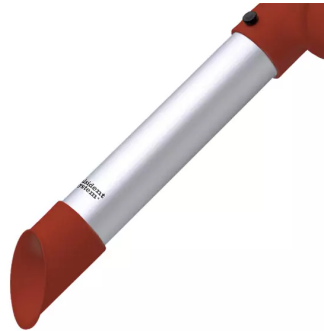
ALSIDENT Rohrdüse NW 50, mit rotem Plastikkopf Artikel-Nr.: 150324