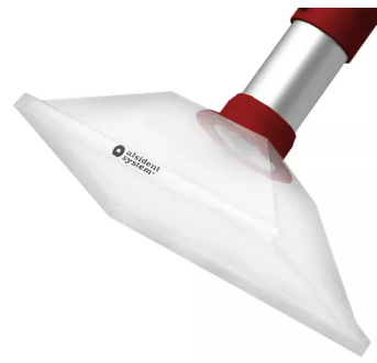
ALSIDENT Absaughaube eckig, NW 50, 265x170 mm, rot Artikel-Nr.: 15020154