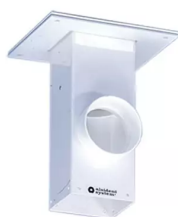
ALSIDENT Deckenkonsole, Abluft nach oben Artikel-Nr.: 225020