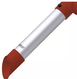
ALSIDENT Rohrdüse NW 50, mit rotem Plastikkopf Artikel-Nr.: 150324