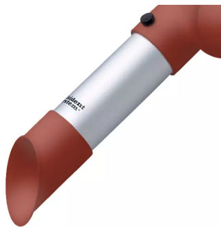
ALSIDENT Rohrdüse NW 50, mit rotem Plastikkopf Artikel-Nr.: 150224