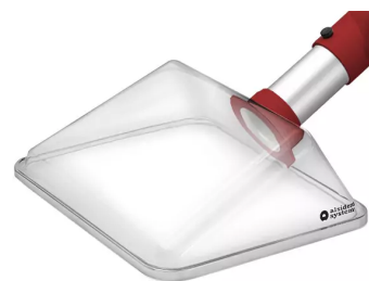
ALSIDENT Absaughaube eckig, NW 50, 245x220 mm, rot Artikel-Nr.: 15024224