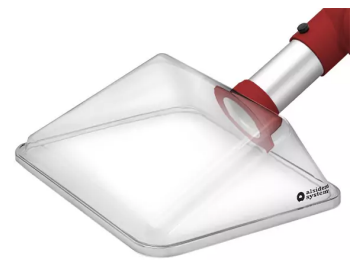
ALSIDENT Absaughaube eckig, NW 50, 245x220 mm, rot Artikel-Nr.: 15024224