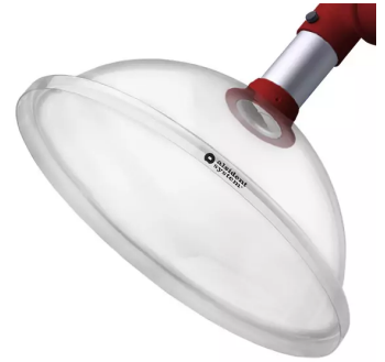
ALSIDENT Absaughaube rund, NW 50, d = 385 mm, rot Artikel-Nr.: 150354