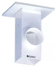
ALSIDENT Deckenkonsole, Abluft nach oben Artikel-Nr.: 225020