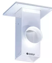
ALSIDENT Deckenkonsole, Abluft seitlich Artikel-Nr.: 225080