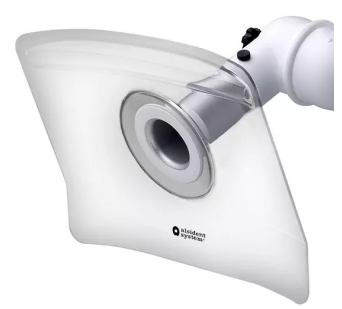
ALSIDENT Absaughaube flach, NW 50, 330 x 240 mm, Artikel-Nr.: 15033245