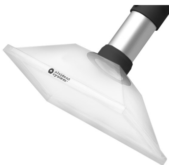
ALSIDENT Absaughaube eckig, NW 50, 265 x 170 mm Artikel-Nr.: 1502015050