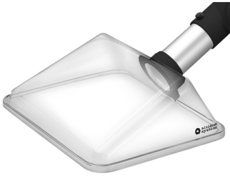
ALSIDENT Absaughaube eckig, NW 50, 245 x 220 mm, Artikel-Nr.: 1502422050001