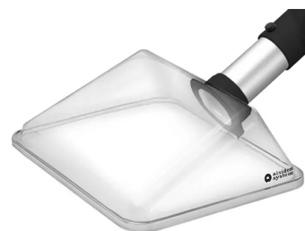
ALSIDENT Absaughaube eckig, NW 50, 350 x 250 mm, Artikel-Nr.: 1502422050