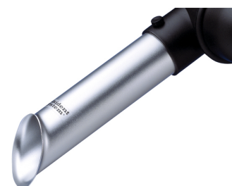
ALSIDENT Rohrdüse NW 50, silber Artikel-Nr.: 15021001