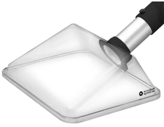
ALSIDENT Absaughaube eckig, NW 50, 245 x 220 mm, Artikel-Nr.: 1502422050001