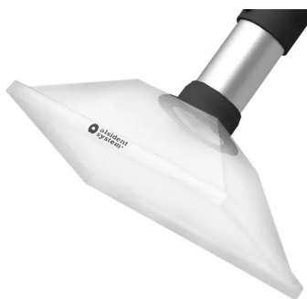
ALSIDENT Absaughaube eckig, NW 50, 265 x 170 mm Artikel-Nr.: 1502015050