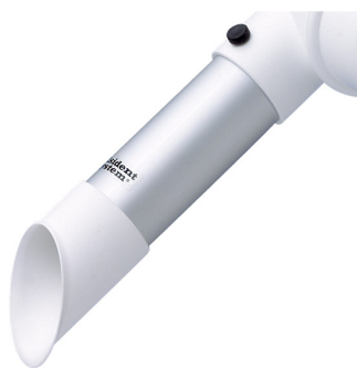
ALSIDENT Rohrdüse NW 50, mit weißem Plastikkopf Artikel-Nr.: 150225