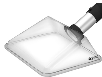
ALSIDENT Absaughaube eckig, NW 50, 350 x 250 mm, Artikel-Nr.: 1502422050