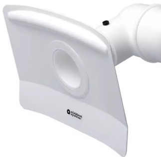
ALSIDENT Absaughaube flach, NW 100, 420 x 280 mm Artikel-Nr.: 1100422875