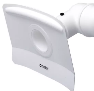
ALSIDENT Absaughaube flach, NW 100, 420 x 280 mm Artikel-Nr.: 1100422875