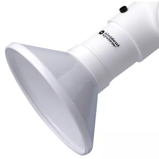
ALSIDENT Absaughaube rund, NW 75, d = 200 mm