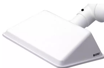
ALSIDENT Absaughaube eckig, NW 75, 420 x 320 mm