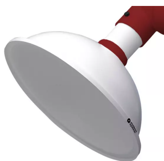
ALSIDENT Absaughaube rund, NW 75, d = 385 mm