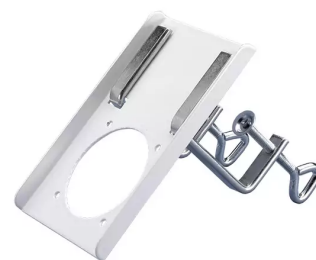
ALSIDENT Tischhalterung NW 75, weiß