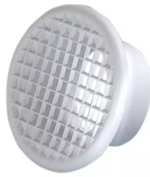
ALSIDENT Schutzgitter NW 75, weiß, chemisch resist Artikel-Nr.: 5177