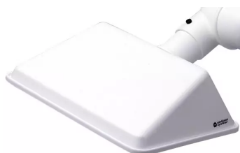
ALSIDENT Absaughaube eckig, NW 75, 420 x 320 mm Artikel-Nr.: 175423275