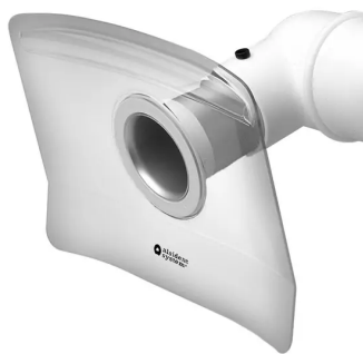
ALSIDENT Absaughaube flach, NW 100 Artikel-Nr.: 110042285