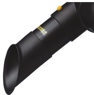
ALSIDENT Rohrdüse NW 75, Länge 250 mm Artikel-Nr.: 175256