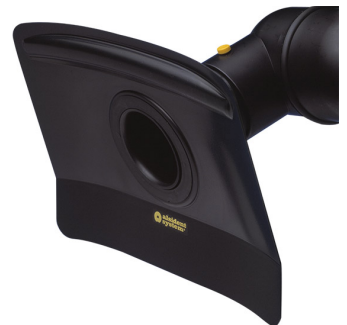
ALSIDENT Absaughaube flach, NW 75, 330 x 240 mm Artikel-Nr.: 17533246