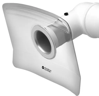
ALSIDENT Absaughaube flach, NW 100 Artikel-Nr.: 110042285