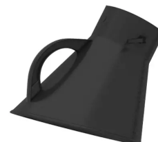
Absaughaube für Absaugarm NW 150 Artikel-Nr.: 662000003