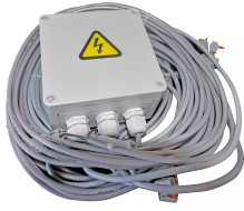
Master-Slave-Steuerung Artikel-Nr.: 150010032