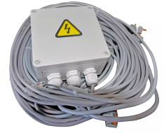
Master-Slave-Verbindungseinheit 24 V DC / 230 V AC Artikel-Nr.: 15001001604