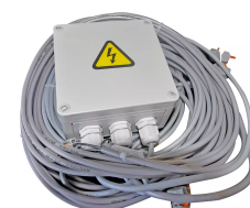
Master-Slave-Steuerung Artikel-Nr.: 150010016