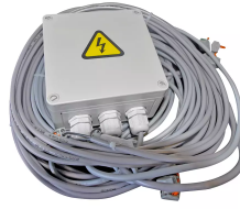
Master-Slave-Steuerung Artikel-Nr.: 15001001602