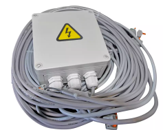
Master-Slave-Steuerung Artikel-Nr.: 150010016