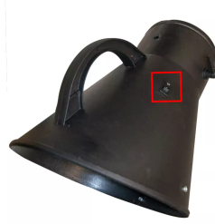
Ein-Ausschaltung über Absaughaube Artikel-Nr.: 96313321