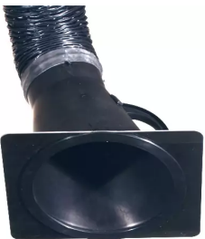
Düsenplatte Artikel-Nr.: 66210