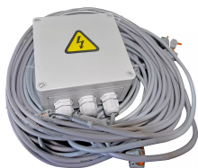
Master-Slave-Steuerung Artikel-Nr.: 150010032