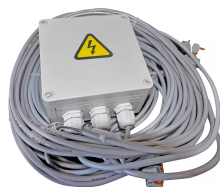
Master-Slave-Steuerung Artikel-Nr.: 15001001602