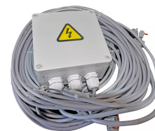
Master-Slave-Verbindungseinheit 24 V DC / 230 V AC Artikel-Nr.: 15001001604