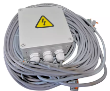
Master-Slave-Steuerung Artikel-Nr.: 150010016