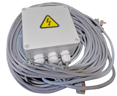
Master-Slave-Verbindungseinheit 24 V DC / 230 V AC Artikel-Nr.: 15001001604