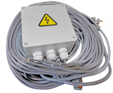
Master-Slave-Steuerung Artikel-Nr.: 150010016