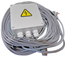
Master-Slave-Steuerung Artikel-Nr.: 150010032