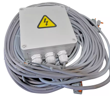
Master-Slave-Steuerung Artikel-Nr.: 15001001602