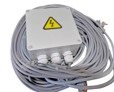
Master-Slave-Steuerung Artikel-Nr.: 150010016