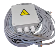
Master-Slave-Verbindungseinheit 24 V DC / 230 V AC Artikel-Nr.: 15001001604