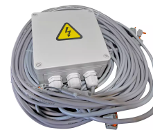
Master-Slave-Steuerung Artikel-Nr.: 150010016