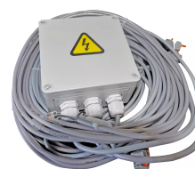
Master-Slave-Verbindungseinheit 24 V DC / 230 V AC Artikel-Nr.: 15001001604