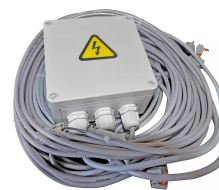
Master-Slave-Steuerung Artikel-Nr.: 150010016