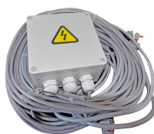
Master-Slave-Steuerung Artikel-Nr.: 15001001602