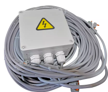
Master-Slave-Steuerung Artikel-Nr.: 150010032