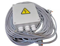
Master-Slave-Steuerung Artikel-Nr.: 150010016