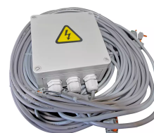
Master-Slave-Verbindungseinheit 24 V DC / 230 V AC Artikel-Nr.: 15001001604