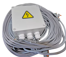
Master-Slave-Steuerung Artikel-Nr.: 15001001602