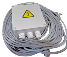
Master-Slave-Steuerung Artikel-Nr.: 15001001602