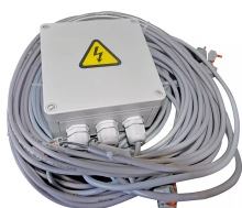
Master-Slave-Steuerung Artikel-Nr.: 150010032