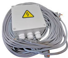
Master-Slave-Steuerung Artikel-Nr.: 150010032