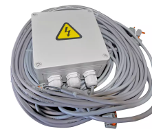
Master-Slave-Verbindungseinheit 24 V DC / 230 V AC Artikel-Nr.: 15001001604