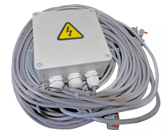
Master-Slave-Steuerung Artikel-Nr.: 150010016