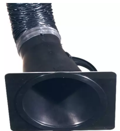
Düsenplatte Artikel-Nr.: 66210