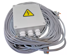
Master-Slave-Verbindungseinheit 24 V DC / 230 V AC Artikel-Nr.: 15001001604