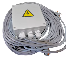
Master-Slave-Steuerung Artikel-Nr.: 15001001602