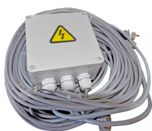
Master-Slave-Steuerung Artikel-Nr.: 150010032