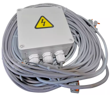
Master-Slave-Steuerung Artikel-Nr.: 150010032