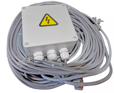
Master-Slave-Steuerung Artikel-Nr.: 150010016