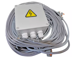
Master-Slave-Verbindungseinheit 24 V DC / 230 V AC Artikel-Nr.: 15001001604