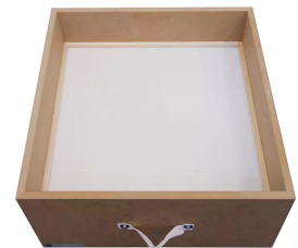
Partikelfilter H13 (bei Aktivkohlekassette) Artikel-Nr.: 100357