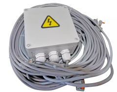
Master-Slave-Steuerung Artikel-Nr.: 150010016