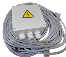
Master-Slave-Steuerung Artikel-Nr.: 15001001602