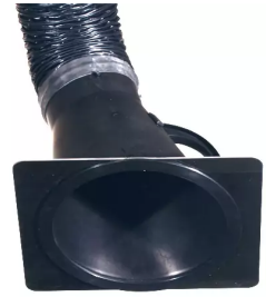
Düsenplatte Artikel-Nr.: 66210