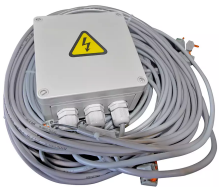
Master-Slave-Steuerung Artikel-Nr.: 150010032