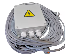
Master-Slave-Verbindungseinheit 24 V DC / 230 V AC Artikel-Nr.: 15001001604