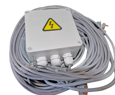
Master-Slave-Steuerung Artikel-Nr.: 150010016