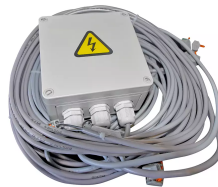
Master-Slave-Steuerung Artikel-Nr.: 15001001602