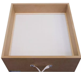
Partikelfilter F9 Artikel-Nr.: 10029