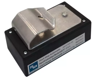
Start-Stopp-Automatik mit Magnetfeldsensor Artikel-Nr.: 963131220224