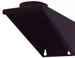
Wandhalter für Ventilator von 0,55 - 1,5 kW Artikel-Nr.: 96010