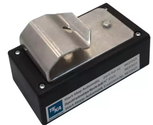
Start-Stopp-Automatik mit Magnetfeldsensor Artikel-Nr.: 963131220123