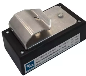
Start-Stopp-Automatik mit Magnetfeldsensor Artikel-Nr.: 963131220224