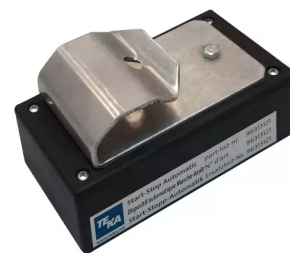
Start-Stopp-Automatik mit Magnetfeldsensor Artikel-Nr.: 963131220224