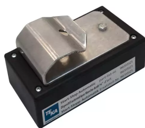
Start-Stopp-Automatik mit Magnetfeldsensor Artikel-Nr.: 963131220224