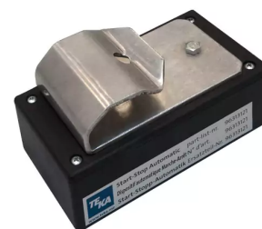
Start-Stopp-Automatik mit Magnetfeldsensor Artikel-Nr.: 963131220123