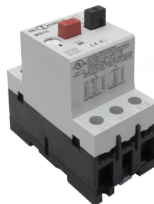
Motorschutzschalter für Einstellbereich: 6,3 - 10 Artikel-Nr.: 9620104