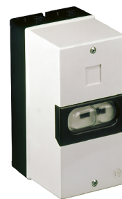
Motorschutzschalter für Einstellbereich: 1,0 - 1,6 Artikel-Nr.: 9620101