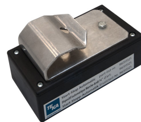
Start-Stopp-Automatik mit Magnetfeldsensor Artikel-Nr.: 963131220224