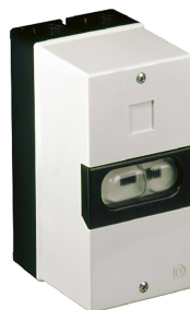
Motorschutzschalter für Einstellbereich: 1,0 - 1,6 Artikel-Nr.: 9620101