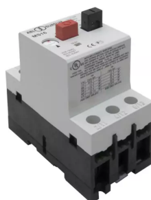
Motorschutzschalter für Einstellbereich: 4,0 - 6,3A Artikel-Nr.: 9620103