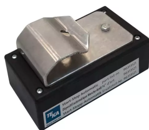
Start-Stopp-Automatik mit Magnetfeldsensor Artikel-Nr.: 963131220123