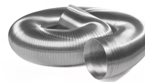
Abluftschlauch NW 160 Artikel-Nr.: 96303