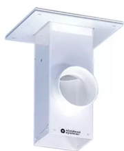
ALSIDENT Deckenkonsole, Abluft nach oben Artikel-Nr.: 225020