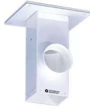
ALSIDENT Deckenkonsole, Abluft nach oben Artikel-Nr.: 225020