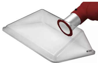
ALSIDENT Absaughaube eckig, NW 75, 420x320 mm, rot