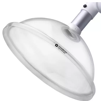
ALSIDENT Absaughaube rund, NW 50, d = 385 mm, weiß Artikel-Nr.: 150355