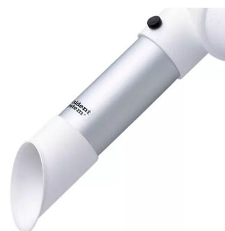
ALSIDENT Rohrdüse NW 50, mit weißem Plastikkopf Artikel-Nr.: 150225