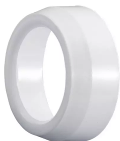
ALSIDENT Reduziermuffe 63 mm - 50 mm, weiß Artikel-Nr.: 46350