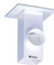
ALSIDENT Deckenkonsole, Abluft nach oben Artikel-Nr.: 225020