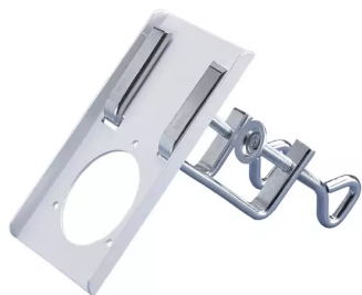
ALSIDENT Tischhalterung NW 50, weiß Artikel-Nr.: 25010