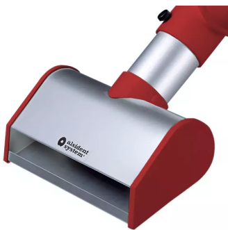
ALSIDENT Schlitzdüse NW 50, Breite 200 mm, rot