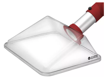
ALSIDENT Absaughaube eckig, NW 50, 245x220 mm, rot