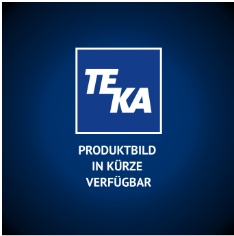
ALSIDENT U-Profil weiß mit rotem Flansch NW 50 Artikel-Nr.: 305054