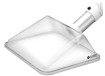
ALSIDENT Absaughaube eckig, NW 50, 300x250mm, weiß