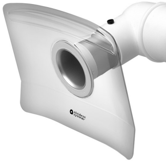
ALSIDENT Absaughaube flach, NW 100 Artikel-Nr.: 110042285