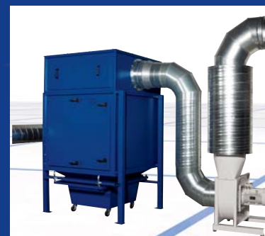
ZPF 9 H