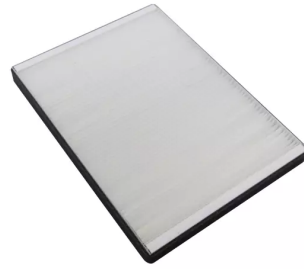
Filtre principal 283x206x25mm pour FilterCase Basi Référence : 978400012