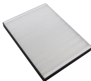
Filtre principal 283x206x25mm pour FilterCase Basi Référence : 978400012