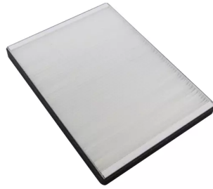
Filtre principal 283x206x25mm pour FilterCase Basi Référence : 978400012