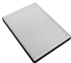
Filtre principal 283x206x25mm pour FilterCase Basi Référence : 978400012